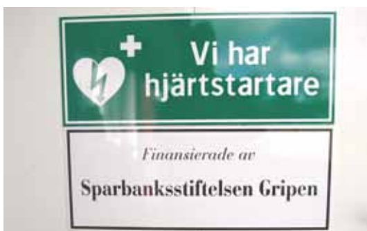
Den här skylten finns numera på SGIF:s klubbhus.

Strövelstorps Gymnastik- och Idrottsförening för uppsättning av hjärtstartare i klubbhuset vid föreningens A-plan. Förutom startaren omfattar bidraget även utbildning i handhavande för ett antal ledare. Klubben ansvarar själv för skötsel och underhåll av hjärtstartaren.