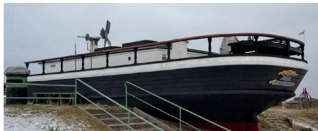
Torekovs sjöfarts- och hembygds museums Kajuta från 1700-talet skall få ett nytt lager färg.