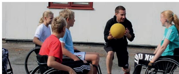
Stiftelsens anslag till Idrottsföreningen Alla Kan IF möjliggjorde investeringar i nya sportrullstolar då de befintliga behövde bytas ut.