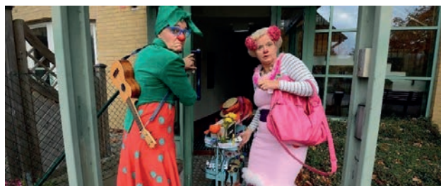
Teater Visit är clowner som besöker demensboenden i Ängelholm och Höganäs kommuner. Stiftelsen stöttar verksamheten.

En kort genomgång visade på att anslagen verkligen gör skillnad för många. Exempelvis deltog fler än 1 000 personer i utbildningen Digitala Banken, ett samarbete mellan Stiftelsen och Swedbank. Den ideella föreningen Dansfabriken i Ängelholm som engagerar fler än 700 ungdomar fick anslag till anpassning av sina nya lokaler, Friskis&Svettis till sitt träningsprojekt på skolor och äldreboenden och Åstorps Ryttarförening med fler än 250 aktiva har nu kunnat bygga om och till sitt klubbhus och bl.a. fått fler toaletter.